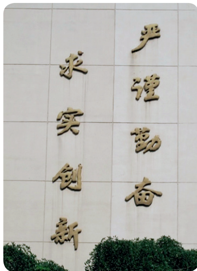
三教外墙上镌刻的“严谨勤奋求实创新”

我们还可以重温“两弹一星功臣”王希季“没有当年的零蛋，哪来高质量导弹”的故事。1975年11月，作为总设计师的王希季成功地主持我国首颗返回式卫星任务。此前，中国返回式卫星仅仅在1974年11月经历过一次失败，而美国、前苏