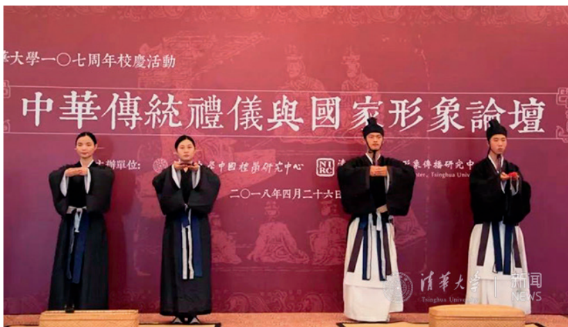
中华传统礼容展演

清华大学国家形象传播研究中心主要依托清华大学新闻与传播学院，由新闻与传播学院、公共管理学院、经济与管理学院、人文学院、建筑学院、美术学院六个学院共同建设，致力于为我国国家形象建设构建科学的理论体系和切实有效的国际传播策略。