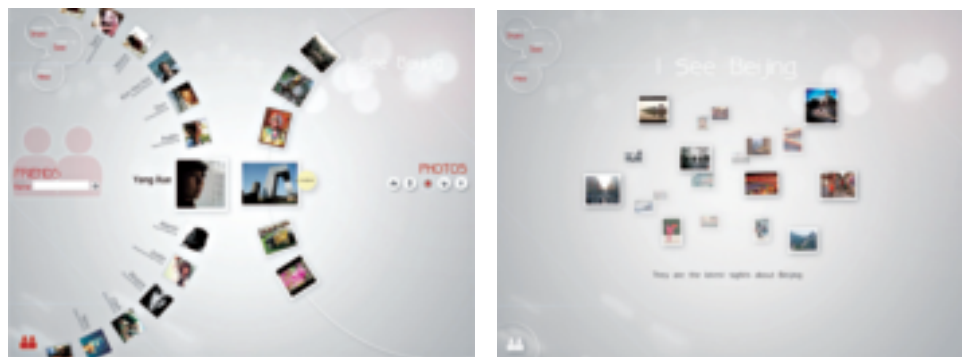
基于社交网站的应用程序设计《I see Beijing》◎ 邓敏