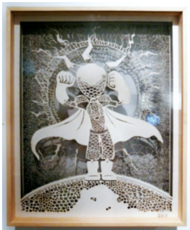
插画设计《天使之泪》◎朱慧颖