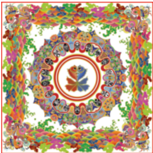
染织艺术设计 《风筝之梦》 © 孙金洋