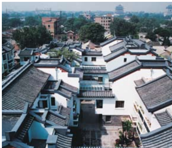
菊儿胡同——院落鸟瞰

菊儿胡同是吴良镛探索北京旧城保护与发展问题的一块“试验田”。自改革开放之初起，他带着一批又一批研究生，进行调研和规划设计。通过居民互助、政府资助、单位补贴等途径和房改加危改的方式，当年破败的“危积漏”（危房、积水、漏雨）院落变成由一座座功能完善、设施齐备的单元式公寓组成的新四合院住宅。扩展形成的“跨院”又突破了北京传统四合院的全封闭结构，形成邻里交往的崭新空间。粉墙黛瓦、绿树成荫，气象一新的菊儿胡同仍旧保持了与北京旧城肌理的有机统一。