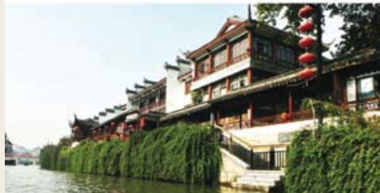
夫子庙建筑恢复重建前后对比