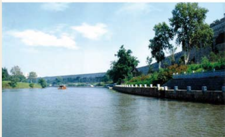
秦淮河的整治与两岸建筑的修缮，既改善了沿河居民的生活环境，又恢复了河道生态