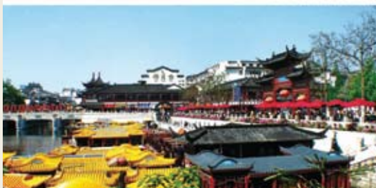
改造后的秦淮河再现了“桨声灯影”的夫子庙秦淮风光