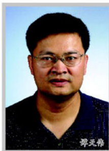
谭天伟(化工系化1) 北京化工大学院长、教授

清华大学硕士、博士。1995年在北京化工大学完成博士后研究后留校工作,担任副教授,教授。作为项目负责人先后承担了国家计委高技术示范工程项目2项,“863”项目2项,国家自然科学基金项目6项等。曾获国家发明二等奖,省部级一等奖,长江学者称号,享受国家特殊津贴。