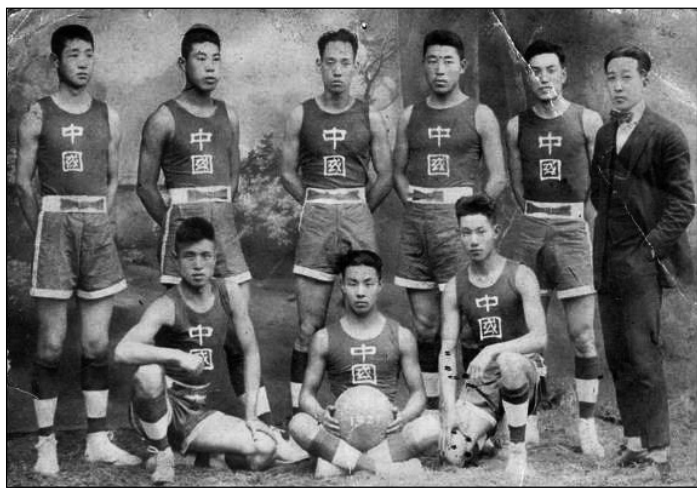
一九二二年中国篮球队参加在上海举行的远东运动会，前右一孙立人

孙立人在清华园读书的那个年代，篮球、排球、足球都是新玩艺儿，小时多病瘦弱的他对这些新游戏特别感兴趣，所以踢完足球，就去打篮球，球场成了他课余的快乐天地。他特别赞赏周诒春提出的“四育并重”，并在玩耍中爱上了体育，成为足球和篮球健将，为国家争得了荣誉——1921 年 5 月，由他担任主力后卫和队长的