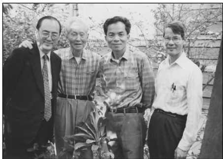
1988年，新竹清华大学洪同教授（左1）等到孙立人（左2）家中搬运专门为新竹清华园培养好的花苗，右1为作者

不是李商隐，不写“相见时难别亦难，东风无力百花残……”他把伤感表示在这三张照片上，希望我们在国外，不要忘掉自