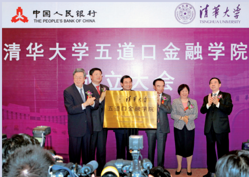
五道口金融学院揭牌仪式

2012年3月29日，清华大学五道口金融学院正式揭牌成立。中国人民银行与清华大学合作，在中国人民银行研究生部的基础上，建设清华大学五道口金融学院。金融学院成为清华大学第17个学院。