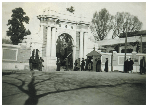
20世纪40年代的二校门

能够成功，知人知事两个要素是缺少不了的。要能知人，事业才能有效地进行，才能事半功倍，才不致闹成人找事，事找人的混乱局面。要能知事，人家的覆辙才不致于重蹈，人家的经验才可以利用。而知人知事又在有赖于服务者彼此的常通消息，互相合作。清华同学在社会服务的人数既多，成绩亦还不错，如能时通声气，互相鼓励，互相劝勉，不独个人的事业得到益处，国家社会也可间接受惠的。至于作事之需要合作，需要群策群力，方能众擎易举，那是更加显而易见的了。