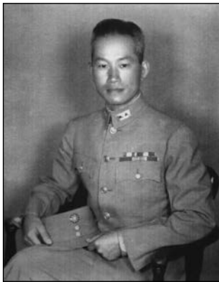
孙立人将军任新一军军长时留影

仁安羌大捷对于孙立人将军本人和新38师来说，是一个历史性的转折点。在此之前，孙立人超人的军事指挥天才是被