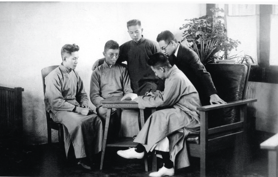
梁思成与学生在一起