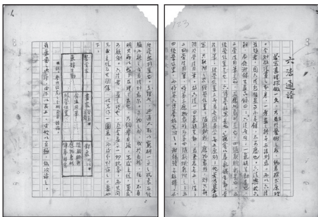
邓以蛰学术著作《六法通论》手稿（1941—1942）（邓仲先捐赠）

邓以蛰（1892.1.9—1973.5.2），安徽怀宁人，清华大学哲学系教授，著名核物理学家邓稼先之父，中国现代美学奠基人之一。