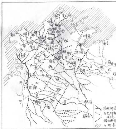
图 1.11 北京地区水系的变迁

钱宁（1922.12.4—1986.12.6），浙江杭州人，1973年入清华任教。中国科学院院士，泥沙运动及河床演变专家。