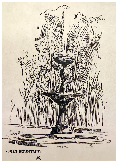
梁思成画 1922 级喷水塔（1920 年代初）

1922 级是清华历史上留美预备部期间毕业人数最多的一个班级（毕业学生为 94 人），其中包括闻一多、罗隆基、高镜莹、萨本栋、时昭涵、吴泽霖、黄子卿、高崇熙、雷海宗、梅贻宝、潘光旦、时昭瀛、闻亦传等著名校友。