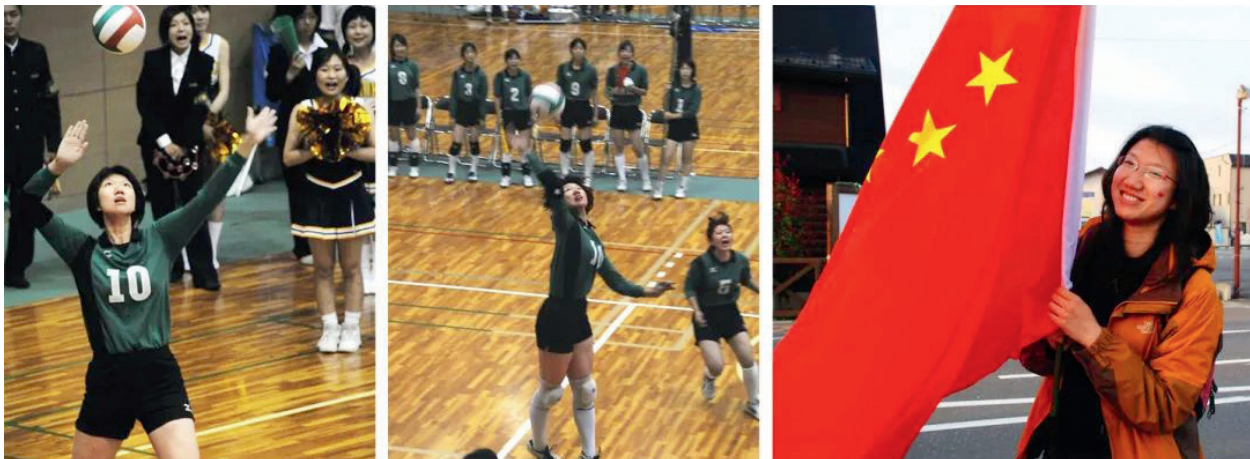
2008年在日本访学期间参加全日本国立大学生运动会获得女排最佳攻手奖，同年赴长野参加留学生自发组织的护送北京奥运圣火活动的