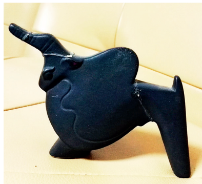
高冀生所买的小牛摆件，已有60多年了

看看这只小牛，一支犄角直指前方，让人能感受到它有一股子“牛劲”。它要向前冲，拱起的背说明它已用尽全身之力……这和当年表现那头小猪时要抓住翘嘴、甩小尾巴的特征一样，表现的都是抽象的美，表达的是一种内涵而不是具象。后来经