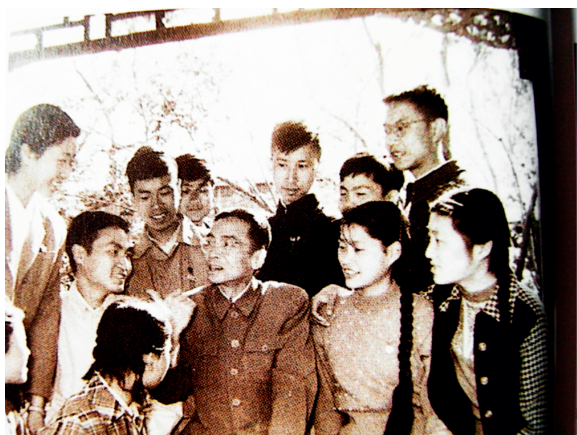
梁先生在清华园的回廊里，给同学们讲解最美垂花门

我们建一班和梁思成先生经常来往，日渐熟悉起来，串门也就成了家常便饭，聊东聊西真长知识。有一回，他亲自带我们这帮同学到工字厅，畅谈古建筑。聊到垂花门时，他说北京最漂亮的垂花门有两处：一个是在颐和园长廊的起步门，另一个就是清华园古月堂的垂花门。