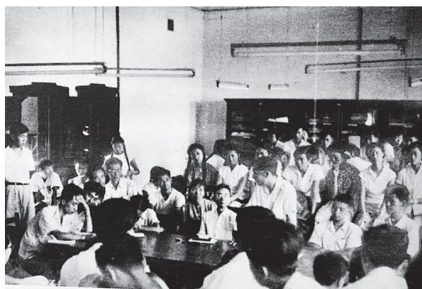
1961年，建一班毕业总结会上，梁先生深情地讲话，并赠画、留言