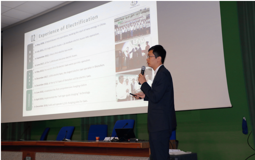
参加国际会议介绍深圳交通