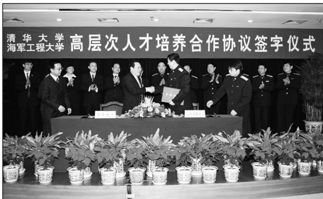
2007年2月26日，在北京海军京海大厦举行“清华大学与海军工程大学高层次人才培养合作协议”签字仪式

2005年以来，清华大学先后有6名国防定向生毕业后来海工大工作。这些优秀学子来到我校后，不但经受住了学校组织的队列、体能，以及具有海军特色的野营拉练、水上科目等高强度入伍训练，又分别在海工大、清华攻读硕士学位，他们很