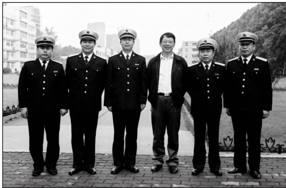
2004年，陈希书记（左4）访问海军工程大学，左2为周长海学长

2004年下半年，海工大接受了迎接海军总部组织的“全军院校教学评价”的重大任务，“迎评”的相关准备工作需要于2007年之前做好，时间紧、要求高，我倍感压力。我仔细研读《全军院校教学评价指标体系》，发现总计52个评价点中有43个都与本科教学质量直接关联。我还查阅了地方高等院校教学评估的情况，发现清华参加了当年的教学评估工作，综合成绩位于全国高校前茅，我马上产生了去清华学习的念头。之后不久，我校领导率队去清华取经，母校领导高度重视，组织召开座谈会，我校有关人员还与清华教务处等部门进行了对口学习。我所接触的母校有关负责同志，都是热情接待、有问必答，毫无保留地给我们传经送宝，令我终