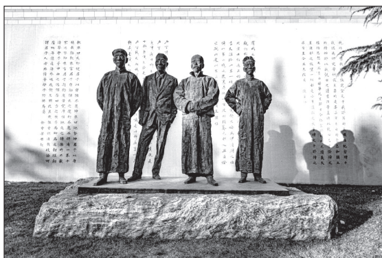
清华大学校园内矗立的四大导师塑像