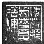
清芬挺秀 华夏增辉