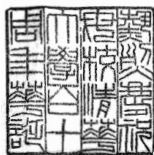
热烈庆祝母校清华大学百十周年华诞

新时代，振兴期，新高度，新格局。 再出发，奋力中华崛起。为科技 创新探路，为民族振兴砥砺。立宏 图，任重而道远，齐努力！